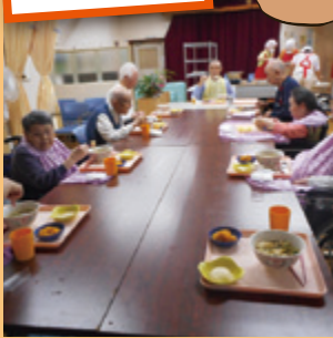
みんなで食べると美味しいなー♪