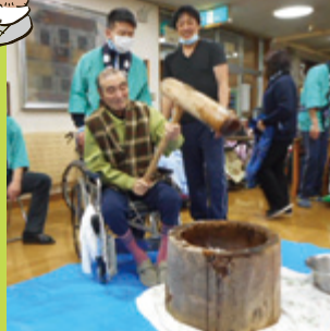
もちつきはこうやるんだ!!