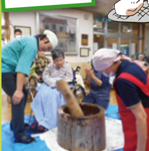
よいしょー!よいしょー!