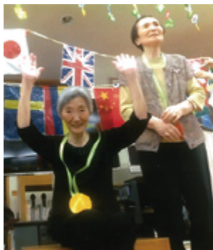
バンザイ！金メダルよ