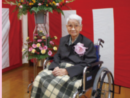
明るい笑顔。これからもお元気で。