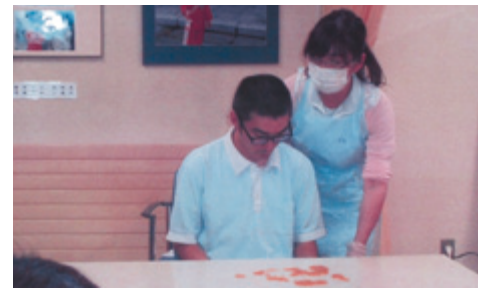
ノロウイルスのための職員勉強会

予防は手洗いが基本ですので体内に入らないようにするために手をきれいにする必要があります。これが基本です。毎年復習を兼ね、冬になる前ノロウイルス発症に伴う演習を職員全員で行っております。