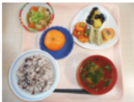
<おせち風>かずのこ、黒豆、栗きんとん、えびなど