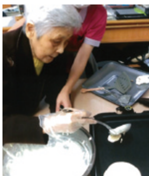
甘～いニオイ♡ トッピングはこれ！