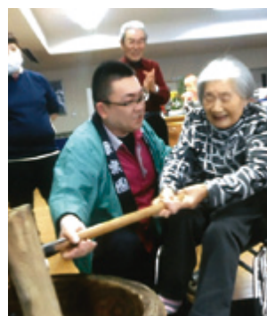
ヨイショ！昔とったきねづか！