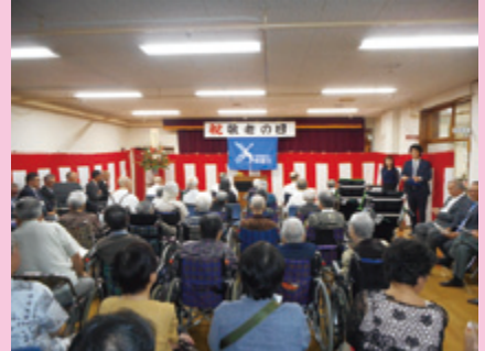
たくさんの方々がお祝いに掛けつけられました。