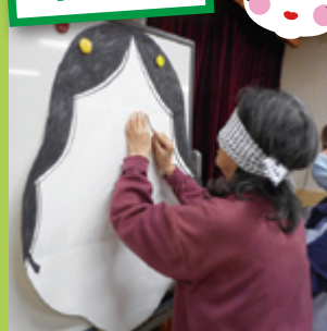
目はこのあたりかな?