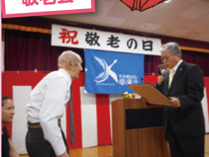
立派に表彰状を頂きました。