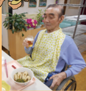
鍋っこにはやっぱりビール