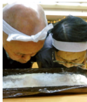
私の得意種目！負けられないわ～