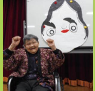
上手に出来ました。