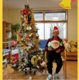
ツリーの前でメリークリスマス