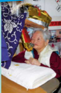
今年も一年お元気で