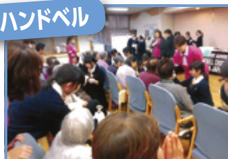
キレイな音色でした♪