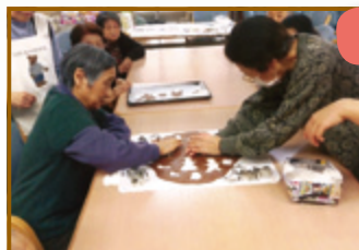
焼き上がりが楽しみ！