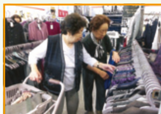
この柄どうかしら…？