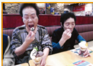
これにして正解だわあ～