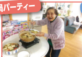
美味しく出来ましたよお～