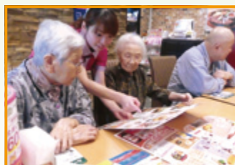
どのスイーツにしようかしら…