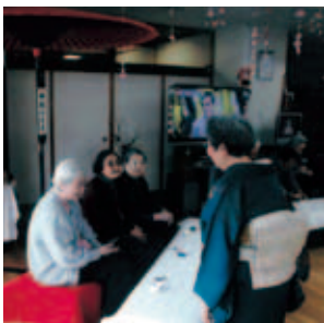
「先生も着物姿で素敵です」