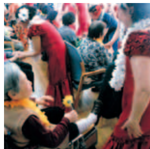
「綺麗なフラガールさん! ハワイに行ったみたいだわ」