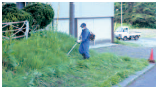
(草刈り作業中の風景)

幸楽園地元救援隊の皆様が、年2回、幸楽園敷地内の一斉草刈りにご協力下さいます。防災活動は勿論、さまざまな機会です施設福祉増進のため活動中です。