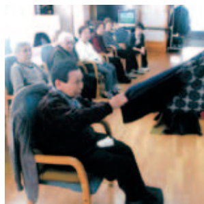
「風呂敷からヨイッショ!」