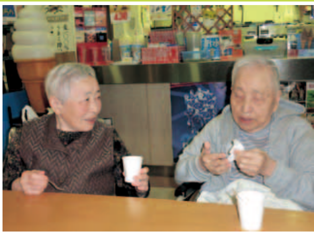
「このアイスうめくてやめられねえ～なあ～」