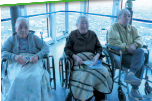
「なんと高いどさきたなあ」 ～セリオンにて～