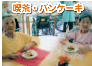
喫茶・パンケーキ