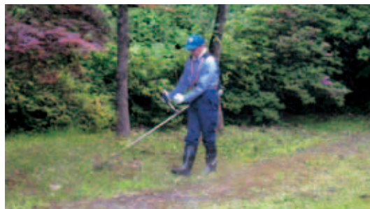
(こんなに綺麗になりました。)