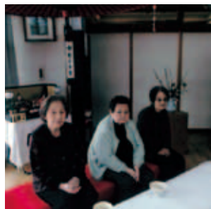
「茶屋の雰囲気最高!」