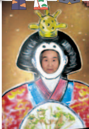
「御内裏様とお雛様に大変身」