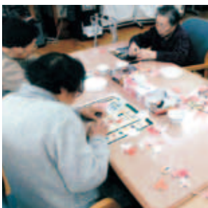
「結構上手に出来たわ」