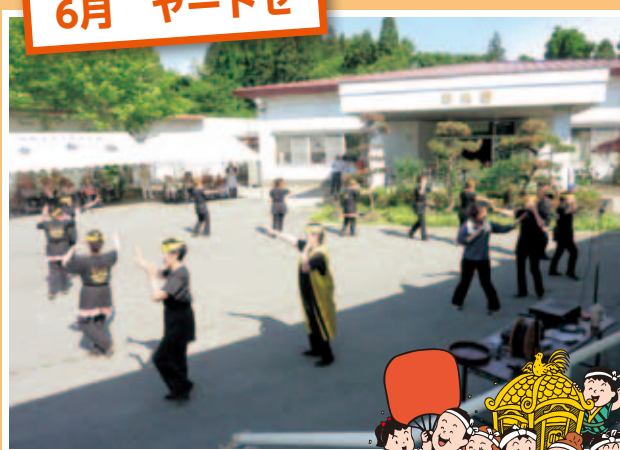
「祭りだソヤーソヤーソヤ」