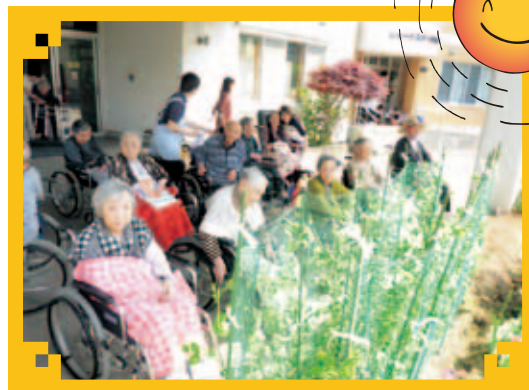
えんどう豆いぐ育ってるごど〜!!