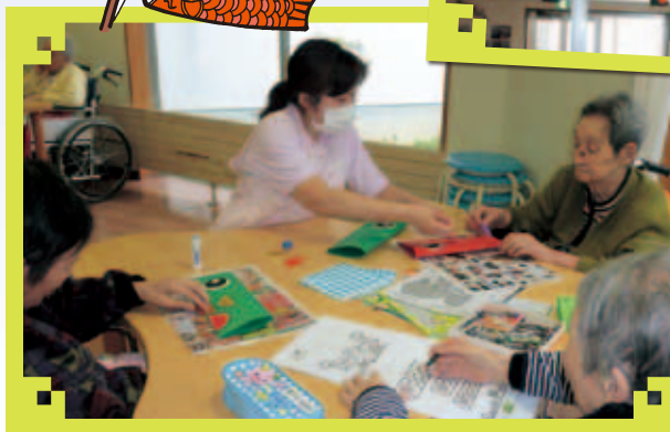
「こいのぼり上手にできると良いなあ」