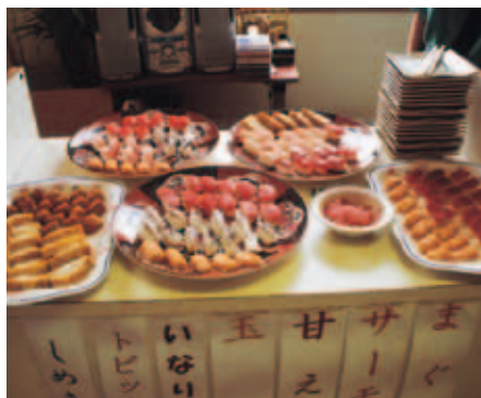
「へい！いらっしゃい！！ お好きなお寿司をどうぞ」

やはり寿司や刺身は皆大好物なようで、お楽しみ昼食会で行った 楽楽寿司 も大変喜んで頂きました。