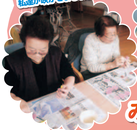
外の桜は咲いてないけど 私達が咲かせましょう。