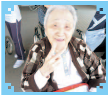
最高の笑顔でハイ!!ピース♥