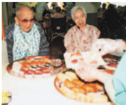
「マグロと…サーモンと… 真剣な眼差しです」