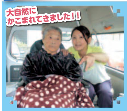
大滝温泉へレッツゴー♪