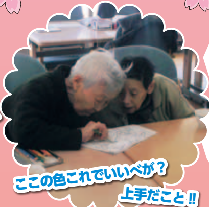
この色これでいいが? 上手なこと!!