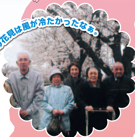
今年の花見は風が冷たかったなあ。