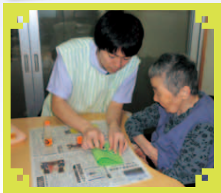
「兄さん作るの上手だなあ〜」