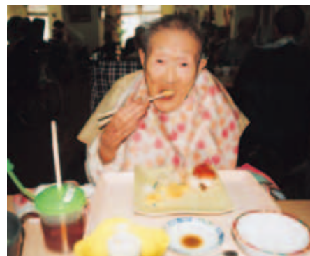
先日100歳を迎えられたカ子様 一口サイズのお寿司をパクリっ♡

※6月～9月の間、衛生面により、 刺身 や マヨネーズ を使用した和え物の提供は中止となります