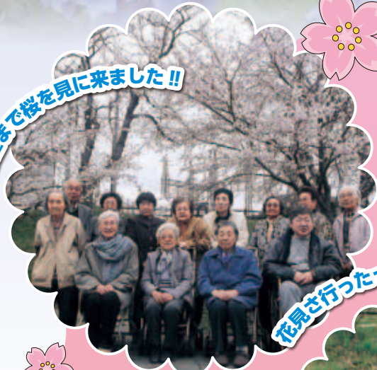
花見さ行ったっけ近所の子供にモチモチだ。