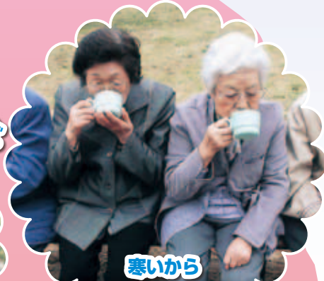
寒いから まずお茶飲まねばね!!