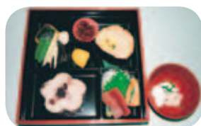
祝い膳をいただきました