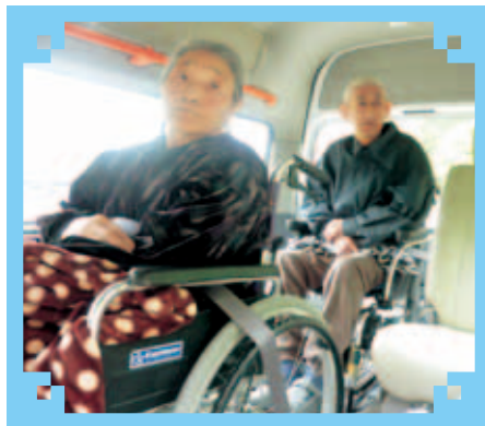
「どごさいぐんだべ…楽しみだ〜」