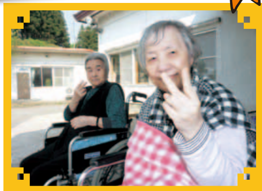
外はポカポカで気持ちが良いなあ〜